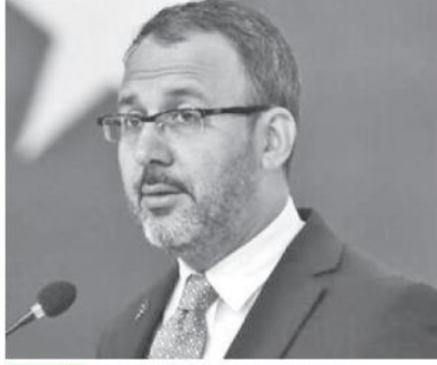
Gençlik ve Spor Bakanı Mehmet Muharrem Kasapoğlu