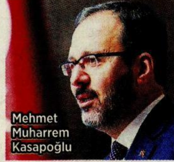
Mehmet Muharrem Kasapoğlu

Kasapoğlu, yeni tip koronavirüsle (Kovid-19) mücadele kapsamında bakanlığına bağlı yurtlarda sürdürülen çalışmalara ilişkin değerlendirmelerde bulundu. Salgına karşı devletin tüm kurum ve kuruluşları arasında çok anlamlı bir iş birliği bulunduğunu vurgulayan Kasapoğlu, "Güçlü bir devlet olmanın avantajlarını yaşıyoruz. Dışişleri Bakanlığımızın koordinesinde dünyanın dört bir yanından gelen vatandaşlarımız İçişleri Bakanlığımızın da katkılarıyla bakanlığımızın yurtlarında misafir ediliyor. 76 ildeki yurtlarımızda, halen yurt