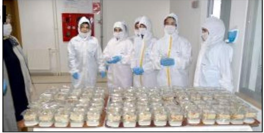
Suudi Arabistan'dan Türkiye'ye getirilerek Çorum'da karantina altına alınan gurbetçilere yurtta görevli çalışanlar, kendi elleriyle mantı hazırladı.

karantinadaki gurbetçilere ikram edildi. Manti jesti karşısında büyük mutluluk duyan gurbetçiler, hem yurt personeline hem de yetkililere teşekkür ettiler. (İHA)